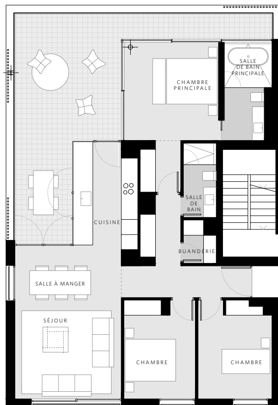
APPARTEMENT A P.1.2